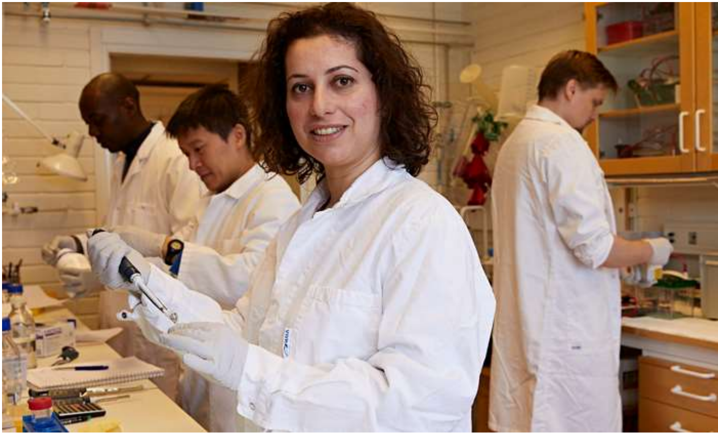
Fyrsträngat dna väcker hopp om ny cancerbehandling