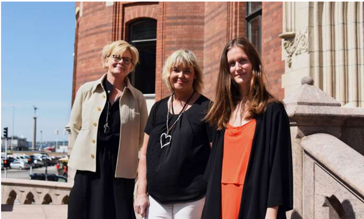
De tävlar i innovation för att skapa samhällsnytta